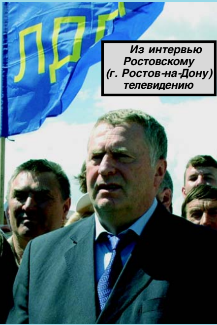
Из интервью Ростовскому (г. Ростов-на-Дону) телевидению

Это все наши достижения. И наш ум, и наши умелые руки делают их здесь, в Ростове. Выступая перед избирателями, я дал формулу, как подбирать кадры, какие должны быть кадры. У нас сегодня демократия и стабильность, огромное количество ресурсов и денег. А как использовать эти свободные 5 триллионов рублей? Такого количества свободных денег нет ни в одной стране мира.