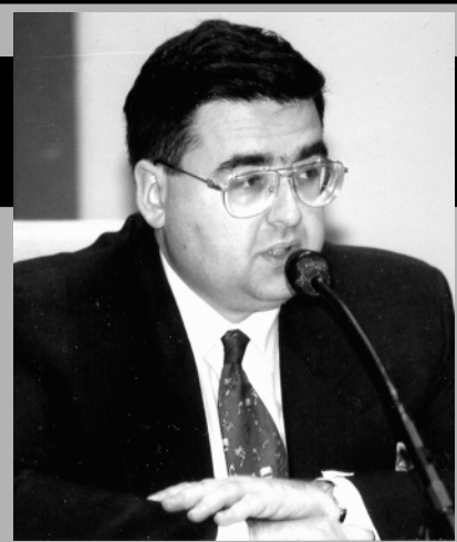
Алексей МИТРОФАНОВ, депутат Госдумы, фракция ЛДПР