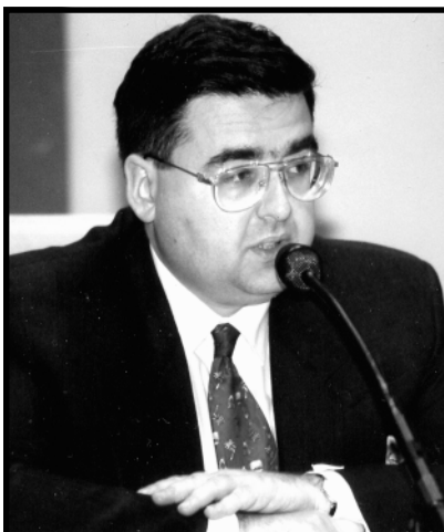
Алексей МИТРОФАНОВ, депутат Госдумы, фракция ЛДПР