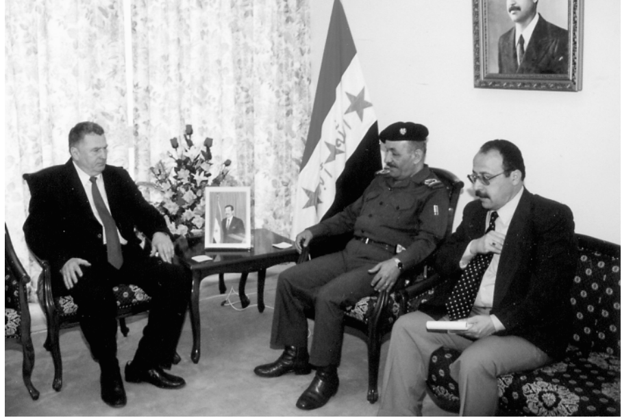
Беседа с вице-президентом Ирака Рамазаном

показывается "Земля обетованная", как это в XIX в. было проделано с Израилем. Ирану скрыто дают возможность аннексировать шиитский Юг (Иран - единственное крупное исламское государство, где шиитская ветвь ислама является государственной). Создается новый очаг напряженности с новой целью мировых конфликтов в центре трех геозападных: Европы, Азии и Африки с непредсказуемыми последствиями. Уже имеющиеся конфлик-